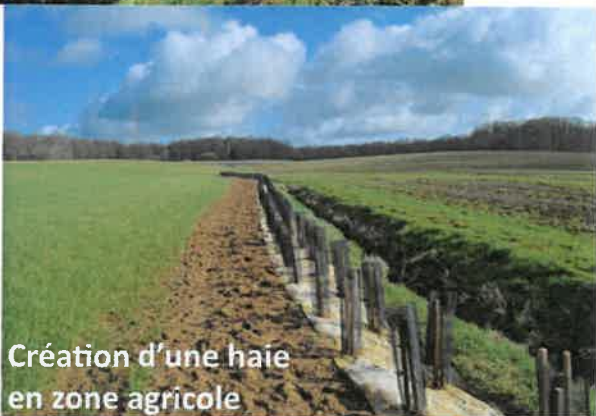
Création d'une haie en zone agricole