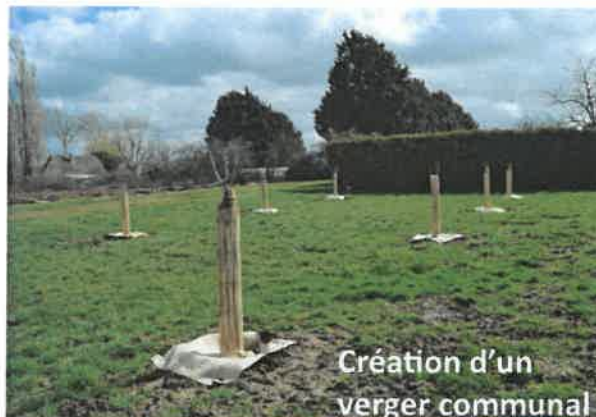
Création d'un verger communal

Le coût comprend la fourniture du matériel, le végétal, le paillage et la main d'oeuvre pour la plantation.