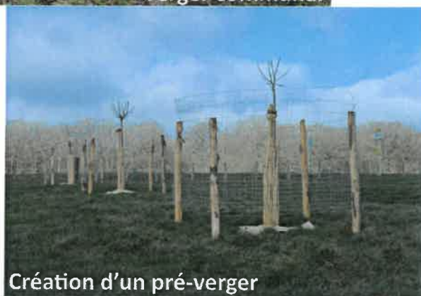
Création d'un pré-verger