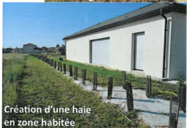
Création d'une haie en zone habitée