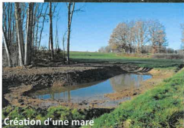
Création d'une mare